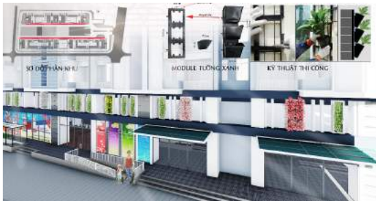
Hình 14. Phối cảnh và hệ thống tường xanh.