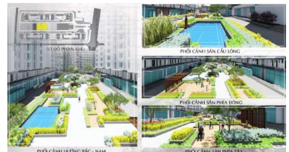
Hình 10. Phối cảnh khu thể dục thể thao.

thể thao và nằm gọn giữa những bồn cây và mái che, giúp tránh say nắng, mất sức cho người vận động nhiều. Sân cầu lông được lắp đặt theo chiều ngang để tránh chói nắng và mất an toàn khi cầu rơi ra ngoài đường giao thông. Sân tiếp theo lắp đặt thêm các thiết bị, dụng cụ thể dục thể thao ngoài trời phục vụ cho nhu cầu của người luyện tập. Các sân không chỉ hướng đến giới trẻ ưa vận động mà còn chú ý đến cả người già và người khuyết tật, các lối tiếp cận đều tạo độ dốc để tiện việc di chuyển. Sân còn lại nằm đối diện và tách biệt với sân đôi, không gian tĩnh hơn với một vài máy tập còn lại là diện tích cho các bài tập và đường chạy. Sử dụng các loại cây có dược tính như Cúc mốc ( Crossostephium chinense ), Bạc hà ( Mentha piperita ) kết hợp với cây cảnh trang trí.