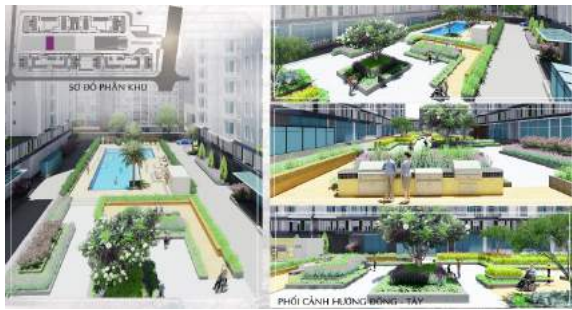
Hình 11. Phối cảnh khu nướng ngoài trời.

◇ Hồ bơi: Hồ trẻ em diện tích 33 m 2 hồ cho người lớn khổ 218 m 2 . Tiếp nối theo phong cách và họa tiết của các khu trước, thay cho các bồn cây thì họa tiết khu này được cách điệu bằng vật liệu khác hoặc sàn hoặc mái che. Được bố trí thêm những bồn cây Cọ dầu để phân chia không gian giữa 2 hồ, nhờ đặc tính ít rụng lá, thân dạng độc trụ làm không gian thông thoáng. Bố trí thêm vòm tấm ngoài trời để giữ vệ sinh hồ cũng như bảo vệ cơ thể trước nhiều tác nhân gây bệnh (Michele Hlavsa, 2016), quầy phục vụ, phòng thay đồ, mái che, ghế nằm, ghế bành theo phong cách tối giản, hiện đại nhưng mang lại một không gian tươi mát và tiện nghi. Xung quanh khu hồ bơi còn được bao bọc bởi tường cây hạn chế tầm nhìn tạo không gian riêng tư và cảm giác an toàn cho người sử dụng.