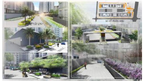
Hình 6. Phối cảnh cổng chào và vành đai cây xanh.

gạch phối kết đậm nhạt theo ô lưới 90 độ. Sự nhấn mạnh được thể hiện bằng cây Bàng đài loan lá cẩm thạch ( Terminalia mantaly ) trên nền cây bụi phủ xanh. Xung quanh chung cư được bao bọc bởi vành đai cây Long não ( Cinnamomum camphora ) trên thảm cỏ lá gừng vừa làm mát tường bê tông vừa phù hợp với tiêu chuẩn cây xanh đô thị, giúp phân chia ranh giới bên ngoài và tăng mảng xanh bên trong.