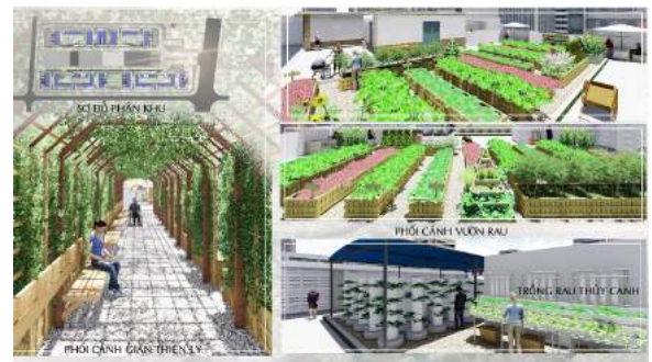
Hình 13. Phối cảnh khu vườn trên mái.

Các loại rau được trồng xen kẽ, theo mùa, theo nhu cầu sử dụng và được phối kết như các loại cây bụi trang trí, kết hợp những giàn dây leo che mát và có thể thu hoạch sản phẩm. Tuy nhiên, cần có những kế hoạch phối kết cây trồng có khả năng xua đuổi côn trùng, sâu hại, hay thu hút thiên địch,... (Nguyễn Thị Nhung, 2005). Sử dụng những khay trồng rau thông minh đang được bán trên thị trường kết hợp các thanh gỗ pallet đã qua sử dụng để tạo khung, kệ trang trí cũng như làm nền phong cách nhẹ nhàng, gần gũi hơn cho vườn rau. Ngoài vấn đề thẩm mỹ, thì tính thực tế cũng không thể thiếu, rau màu thường là những loại ngăn ngừa cần chăm sóc thường xuyên vì thế cần phải đảm bảo lối tiếp cận thu hoạch cũng như tham quan dễ dàng, chiếu sáng cũng phải tuân theo nguyên tắc bố trí đèn sân vườn và không ảnh hưởng đến sự sinh trưởng của rau màu, quan trọng hơn là giải quyết vấn đề thoát nước thừa hay nước mưa chảy tràn. Ngoài ra, đây còn là nơi áp dụng, thí điểm các kỹ thuật, loại hình mới, giúp người dân gần hơn với các công nghệ mới trong chương trình nông nghiệp hóa đô thị. Như các hình thức của mô hình thủy canh vẫn đang được ưa chuộng vì tính hiệu quả và thẩm mỹ của chúng mang lại.