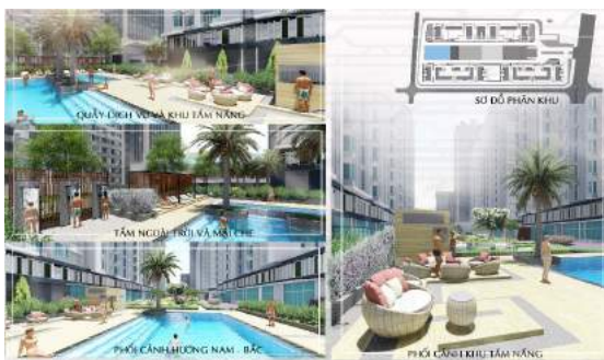
Hình 12. Phối cảnh khu hồ bơi.

◇ Hồ bơi: Hồ trẻ em diện tích 33 m 2 hồ cho người lớn khổ 218 m 2 . Tiếp nối theo phong cách và họa tiết của các khu trước, thay cho các bồn cây thì họa tiết khu này được cách điệu bằng vật liệu khác hoặc sàn hoặc mái che. Được bố trí thêm những bồn cây Cọ dầu để phân chia không gian giữa 2 hồ, nhờ đặc tính ít rụng lá, thân dạng độc trụ làm không gian thông thoáng. Bố trí thêm vòm tấm ngoài trời để giữ vệ sinh hồ cũng như bảo vệ cơ thể trước nhiều tác nhân gây bệnh (Michele Hlavsa, 2016), quầy phục vụ, phòng thay đồ, mái che, ghế nằm, ghế bành theo phong cách tối giản, hiện đại nhưng mang lại một không gian tươi mát và tiện nghi. Xung quanh khu hồ bơi còn được bao bọc bởi tường cây hạn chế tầm nhìn tạo không gian riêng tư và cảm giác an toàn cho người sử dụng.