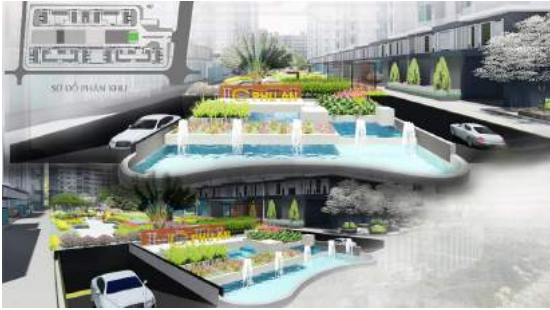
Hình 7. Phối cảnh hồ cảnh quan và bảng tên.

( Costus woodsonii ) để tạo ra sự tương phản xanh - đỏ - xanh qua ba bậc.