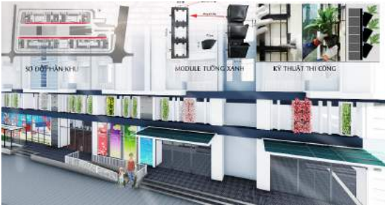
Hình 14. Phối cảnh và hệ thống tường xanh.