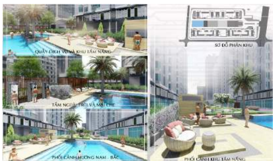
Hình 12. Phối cảnh khu hồ bơi.

◊ Hồ bơi: Hồ trẻ em diện tích 33 m 2 hồ cho người lớn khổ 218 m 2 . Tiếp nối theo phong cách và họa tiết của các khu trước, thay cho các bồn cây thì họa tiết khu này được cách điệu bằng vật liệu khác hoặc sàn hoặc mái che. Được bố trí thêm những bồn cây Cọ dầu để phân chia không gian giữa 2 hồ, nhờ đặc tính ít rụng lá, thân dạng độc trụ làm không gian thông thoáng. Bố trí thêm vòm tẩm ngoài trời để giữ vệ sinh hồ cũng như bảo vệ cơ thể trước nhiều tác nhân gây bệnh (Michele Hlavsa, 2016), xây phục vụ, phòng thay đồ, mái che, ghế nằm, ghế bành theo phong cách tối giản, hiện đại nhưng mang lại một không gian tươi mát và tiện nghi. Xung quanh khu hồ bơi còn được bao bọc bởi tường cây hạn chế tầm nhìn tạo không gian riêng tư và cảm giác an toàn cho người sử dụng.