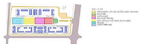
Hình 4. Phân khu chức năng khu vực thiết kế.