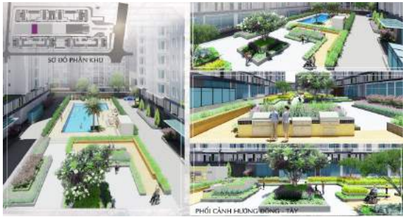
Hình 11. Phối cảnh khu vườn ngoài trời.

◊ Hồ bơi: Hồ trẻ em diện tích 33 m 2 hồ cho người lớn khổ 218 m 2 . Tiếp nối theo phong cách và họa tiết của các khu trước, thay cho các bồn cây thì họa tiết khu này được cách điệu bằng vật liệu khác hoặc sàn hoặc mái che. Được bố trí thêm những bồn cây Cọ dầu để phân chia không gian giữa 2 hồ, nhờ đặc tính ít rụng lá, thân dạng độc trụ làm không gian thông thoáng. Bố trí thêm vòm tẩm ngoài trời để giữ vệ sinh hồ cũng như bảo vệ cơ thể trước nhiều tác nhân gây bệnh (Michele Hlavsa, 2016), xây phục vụ, phòng thay đồ, mái che, ghế nằm, ghế bành theo phong cách tối giản, hiện đại nhưng mang lại một không gian tươi mát và tiện nghi. Xung quanh khu hồ bơi còn được bao bọc bởi tường cây hạn chế tầm nhìn tạo không gian riêng tư và cảm giác an toàn cho người sử dụng.