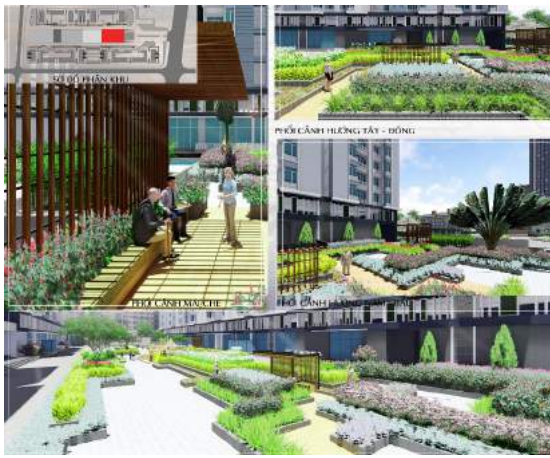
Hình 8. Phối cảnh vườn nghỉ.

◊ Khu vui chơi trẻ em: Đây là khu trung tâm của công viên bởi nhu cầu sử dụng và điểm nhấn hình khối trong tổng thể thiết kế. Thiết kế trò chơi cho trẻ theo ý tưởng giải mã mê cung, tạo sự mới lạ hơn các trò chơi có sẵn có trên thị trường. Đối với thiết kế này, đồ án mong muốn hình thành tính khám phá, logic trong trẻ từ nhỏ. Hiểu được tính hiếu động của trẻ, nên vấn đề an toàn được đặt lên hàng đầu. Toàn bộ sân chơi được trải cát mịn, trò chơi làm bằng gỗ, nhựa và lưới trên nền sân cát giúp tiết kiệm một phần chi phí. Bên cạnh đó, kết hợp với sân EPDM theo đường nét chủ đề của chung cư giúp làm đa dạng môi trường vui chơi cho trẻ. Xung quanh sân chơi là những dãy ghế dài dựa lưng thành bồn cây cho phụ huynh quan sát trẻ. Những bồn cây ôm theo sân chơi chính còn có chức năng giới hạn không gian, hạn chế trẻ chạy ra ngoài đường.