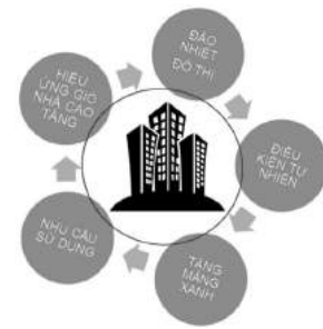
Hình 1. Các ảnh hưởng đến thiết kế cảnh quan chung cư Him Lam Phú An.

Chung cư Him Lam Phú An định hướng thiết kế theo phong cách hiện đại, tạo không gian sống năng động và tiện nghi. Lấy ý tưởng từ vi mạch điện tử, mong muốn tạo ra sự kết hợp giữa những thành quả của công nghệ với thẩm mỹ cảnh quan, những thứ tưởng chừng như khô khan cũng có thể tạo nên một tiếng nói riêng khi người ta biết cảm nhận nó. Sự ra đời của vi mạch điện tử là bước ngoặt cho cuộc Cách mạng khoa học kỹ thuật. Chính vì thế, ý tưởng này còn theo đúng chủ đề của chung cư, định hướng phát triển theo hướng năng động, dân cư chủ yếu là các gia đình 1-2 thế hệ.