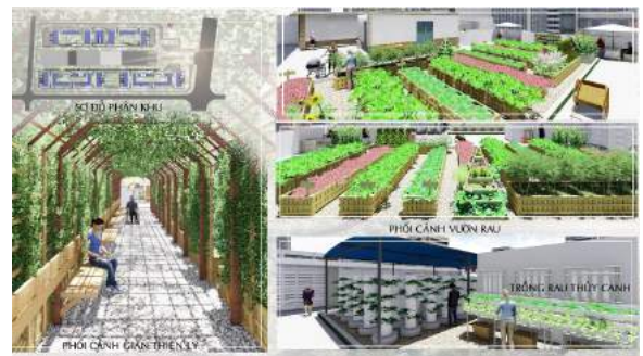
Hình 13. Phối cảnh khu vườn trên mái.

Các loại rau được trồng xen kẽ, theo mùa, theo nhu cầu sử dụng và được phối kết như các loại cây bụi trang trí, kết hợp những giàn dây leo che mát và có thể thu hoạch sản phẩm. Tuy nhiên, cần có những kế hoạch phối kết cây trồng có khả năng xua đuổi côn trùng, sâu hại, hay thu hút thiên địch,.. (Nguyễn Thị Nhung, 2005). Sử dụng những khay trồng rau thông minh đang được bán trên thị trường kết hợp các thanh gỗ pallet đã qua sử dụng để tạo khung, kệ trang trí cũng như làm nền phong cách nhẹ nhàng, gần gũi hơn cho vườn rau. Ngoài vấn đề thẩm mỹ, thì tính thực tế cũng không thể thiếu, rau màu thường là những loại ngăn ngừa cần chăm sóc thường xuyên vì thế cần phải đảm bảo lối tiếp cận thu hoạch cũng như tham quan dễ dàng, chiếu sáng cũng phải tuân theo nguyên tắc bố trí đèn sân vườn và không ảnh hưởng đến sự sinh trưởng của rau màu, quan trọng hơn là giải quyết vấn đề thoát nước thừa hay nước mưa chảy tràn. Ngoài ra, đây còn là nơi áp dụng, thí điểm các kỹ thuật, loại hình mới, giúp người dân gần hơn với các công nghệ mới trong chương trình nông nghiệp hóa đô thị. Như các hình thức của mô hình thủy canh vẫn đang được ưa chuộng vì tính hiệu quả và thẩm mỹ của chúng mang lại.