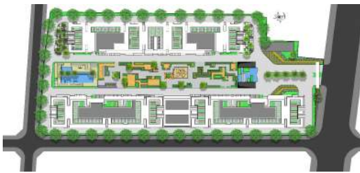
Hình 5. Mặt bằng tổng thể.

Cảnh quan chung cư Phú An được thiết kế theo phong cách đơn giản và hiện đại. Những đường nét khỏe khoắn của bồn cây và vật liệu nền tạo mối liên kết xuyên suốt từ cổng chào đầu đến cuối công trình, từ khu động đến khu tĩnh, từ khu công năng này đến khu công năng khác. Đi từ ngoài vào, sau khi được chào đón bằng cổng chào, thì tiểu cảnh bằng tên chung cư ở giữa sẽ hướng người vào đến công viên với trung tâm, cũng như hướng người lái xe đỗ xe ở tầng hầm ngay bên dưới. Công viên bắt đầu bởi tiểu cảnh bằng tên chung cư, sau đó là khu vườn nghỉ chủ yếu dành cho người lớn tuổi, tiếp theo là khu vui chơi trẻ em, đây cũng được xem là khu trung tâm. Tiếp nối với sự náo động là khu dành cho các hoạt động vui chơi, thể dục thể thao. Cuối cùng là khu phức hợp nướng ngoài trời và hồ bơi, là nơi lý tưởng cho những buổi tiệc.