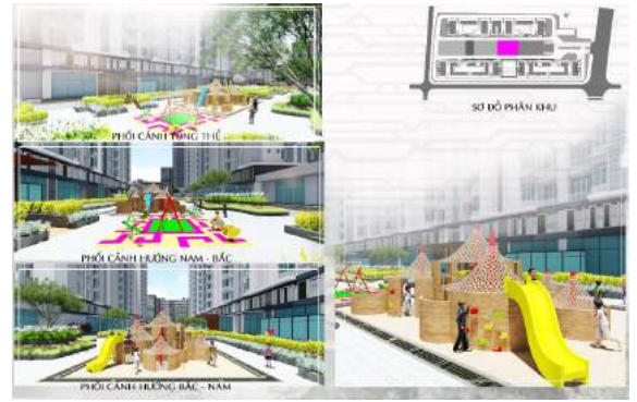
Hình 9. Phối cảnh khu vui chơi trẻ em.

◊ Khu thể dục thể thao: Tất cả các sân được mở theo chiều dài để thuận tiện cho các hoạt động