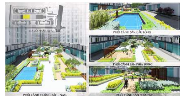
Hình 10. Phối cảnh khu thể dục thể thao.

thể thao và nằm gọn giữa những bồn cây và mái che, giúp tránh say nắng, mất sức cho người vận động nhiều. Sân cầu lông được lắp đặt theo chiều ngang để tránh chói nắng và mất an toàn khi cầu rơi ra ngoài đường giao thông. Sân tiếp theo lắp đặt thêm các thiết bị, dụng cụ thể dục thể thao ngoài trời phục vụ cho nhu cầu của người luyện tập. Các sân không chỉ hướng đến giới trẻ ưa vận động mà còn chú ý đến cả người già và người khuyết tật, các lối tiếp cận đều tạo độ dốc để tiện việc di chuyển. Sân còn lại nằm đối diện và tách biệt với sân đôi, không gian tĩnh hơn với một vài máy tập còn lại là diện tích cho các bài tập và đường chạy. Sử dụng các loại cây có dược tính như Cúc mốc ( Crossostephium chinense ), Bạc hà ( Mentha piperita ) kết hợp với cây cảnh trang trí.